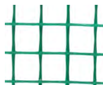
4500152 Rotoli/rolls m 1x50