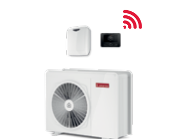
Nimbus Pocket M NET R32 Monobloc

REZERVOR DE APĂ CALDĂ MENAJERĂ disponibil cu 3 capacități: 200 l, 300 l sau 450 l