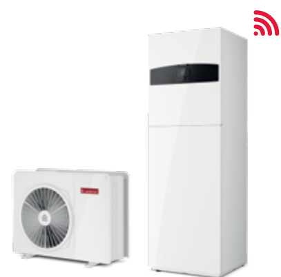
Nimbus Compact NET R32 Split & Monobloc

Disponibil într-o gamă largă de configurații și dimensiuni