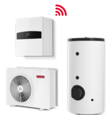
Nimbus Flex NET R32 Split & Monobloc