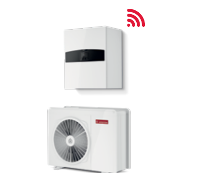
Nimbus Plus NET R32 Split & Monobloc